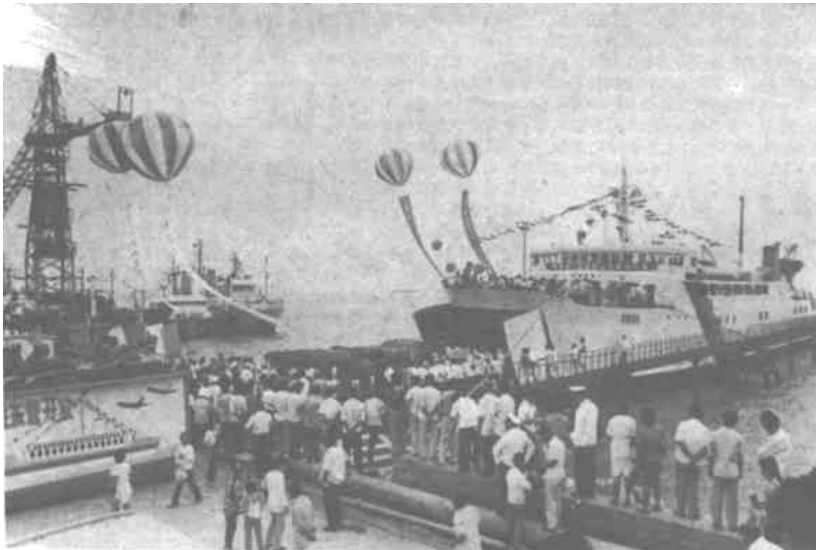
图为首航日旅客、车辆乘船待航时的情景。